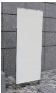
板付き看板台座サイズ 縦1,800×幅700mm (2枚)