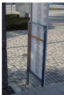
ステンレス台座サイズ ・幅 627mm ・幅 927mm