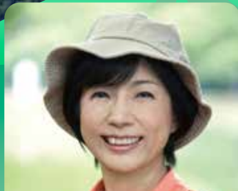
市毛 良枝 (俳優)