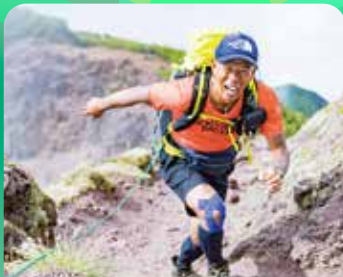
田中 陽希 (プロアドベンチャーレーサー)